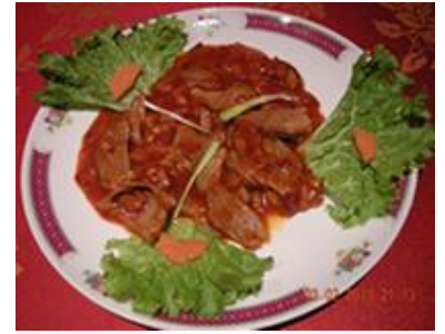
Canard sauce piquante 11€