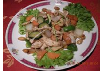
Poulet aux amandes 9 €