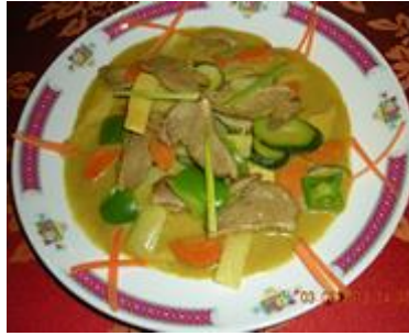
Canard au curry 11€