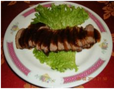
Canard laqué 11€