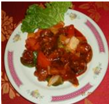
Porc aigre-doux 9 €