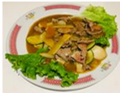
Bœuf sauce curry 10 €