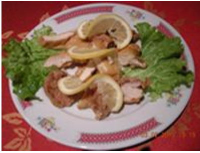
Poulet au citron 9 €