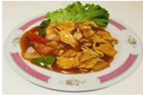
Poulet aigre-doux 9 €