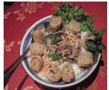
Nems & Bo Bun 12.90€