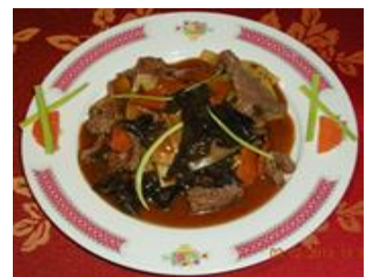
Bœuf champignons + bambou 10 €