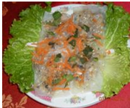
Crêpes au porc 9 €