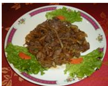
Bœuf au gingembre 10 €